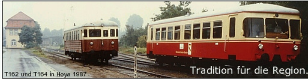
T162 und T164 in Hoyas 1987

Unsere Homepage liefert Ihnen umfassend und aktuell die neuesten Nachrichten und Informationen zur Bremervörde-Osterholzer Eisenbahn - dem Moorexpress - und den Bremervörde-Osterholzer Eisenbahnfreunden. Erfahren Sie, was den Moorexpress so besonders macht und unser Handeln so wichtig.