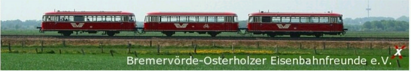
Bremervörde-Osterholzer Eisenbahnfreunde e.V.