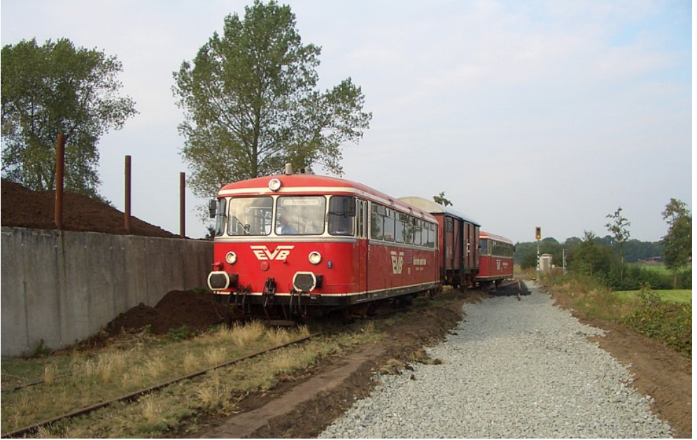
Moorexpress: Bauarbeiten im September 2005 in Neu St. Jürgen V274 schnappt Frische Luft ! – Gnarrenburg 2003