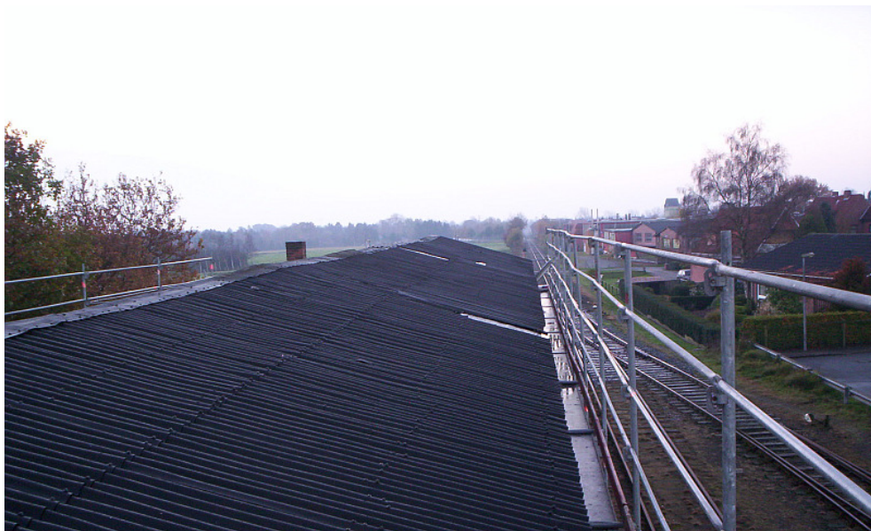
Das lokschuppendach Vorher und Nachher.